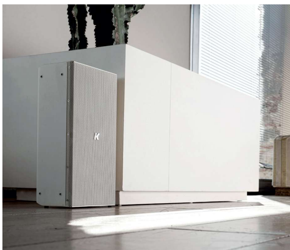
Ein unauffälliger Subwoofer ist für das Klangfundament der Lautsprechersysteme von K-array zuständig

Dank innovativer Technologie und jahrzehntelanger Audioexpertise verwandelt K-array mit seinen Lautsprechern jeden Raum in ein akustisches Erlebnis, sei es im Konferenzraum, Restaurant, Hotel, Yacht oder zuhause. K-array bietet zudem eigene, optimal abgestimmte System-Amplifier an, mit denen die Lautsprecher optimal mit dem entsprechend hochwertigen Musikmaterial beschickt werden können. Die integrierte DSP-Steuerung ermöglicht eine präzise Klangoptimierung und schützt die Lautsprecher auch bei hoher Lautstärke – besonders relevant für kompakte Systeme.